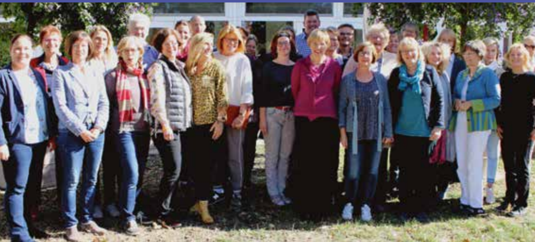
Ev. und kath. Fachberater*innen